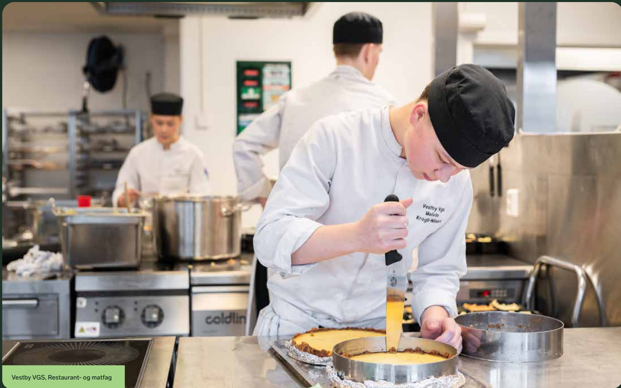
Vestby VGS, Restaurant- og matfag