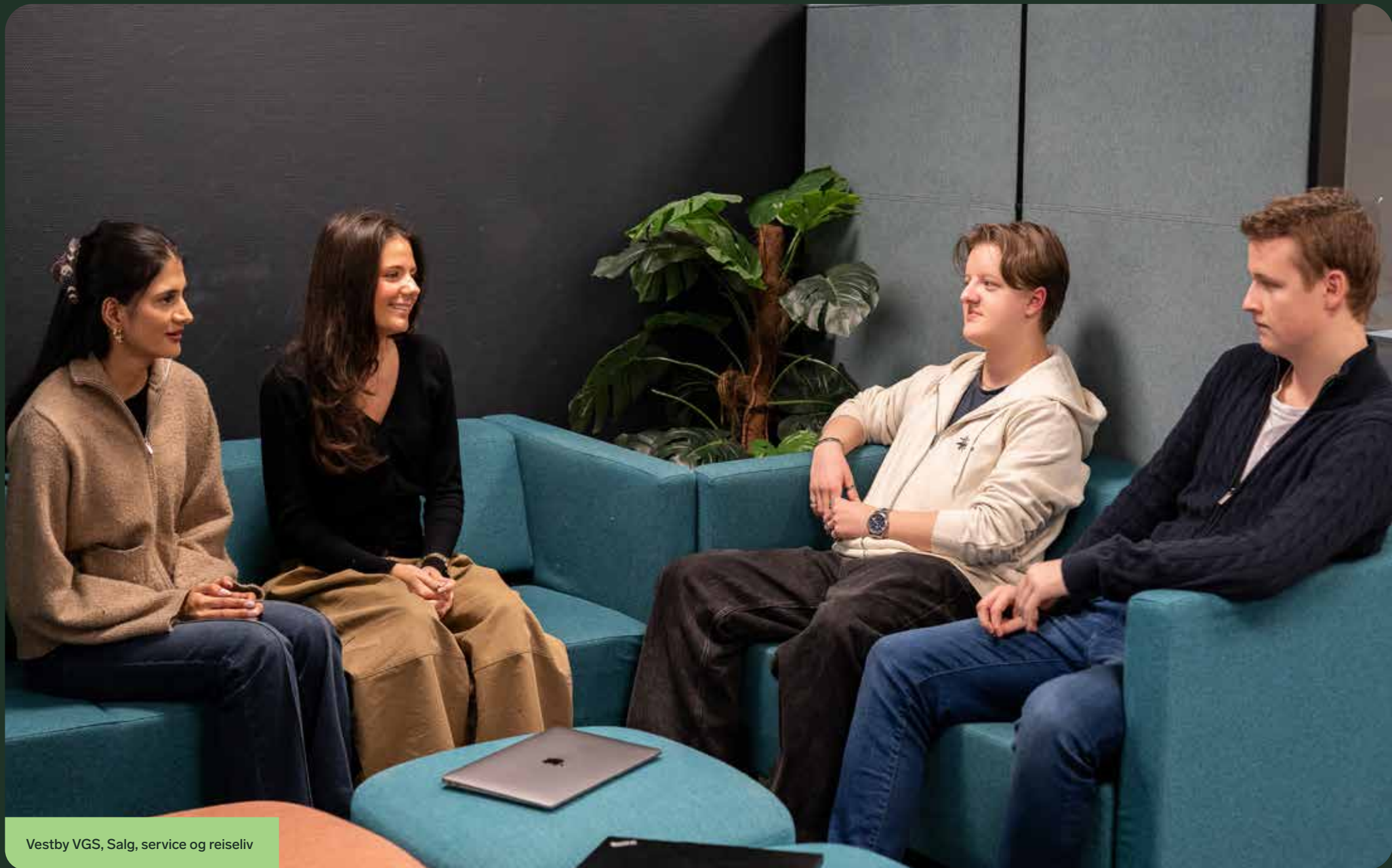
Vestby VGS, Salg, service og reiseliv