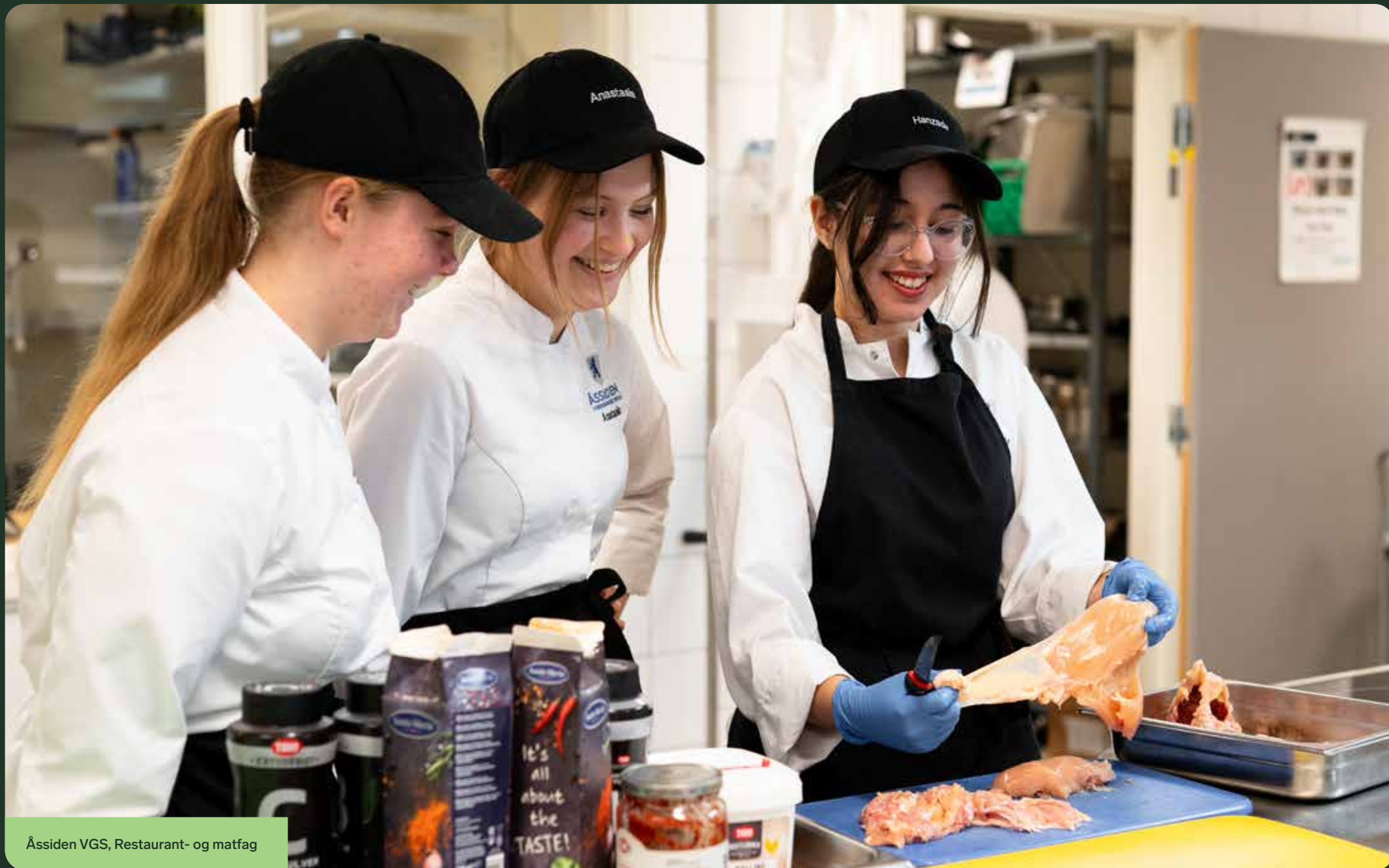
Åssiden VGS, Restaurant- og matfag