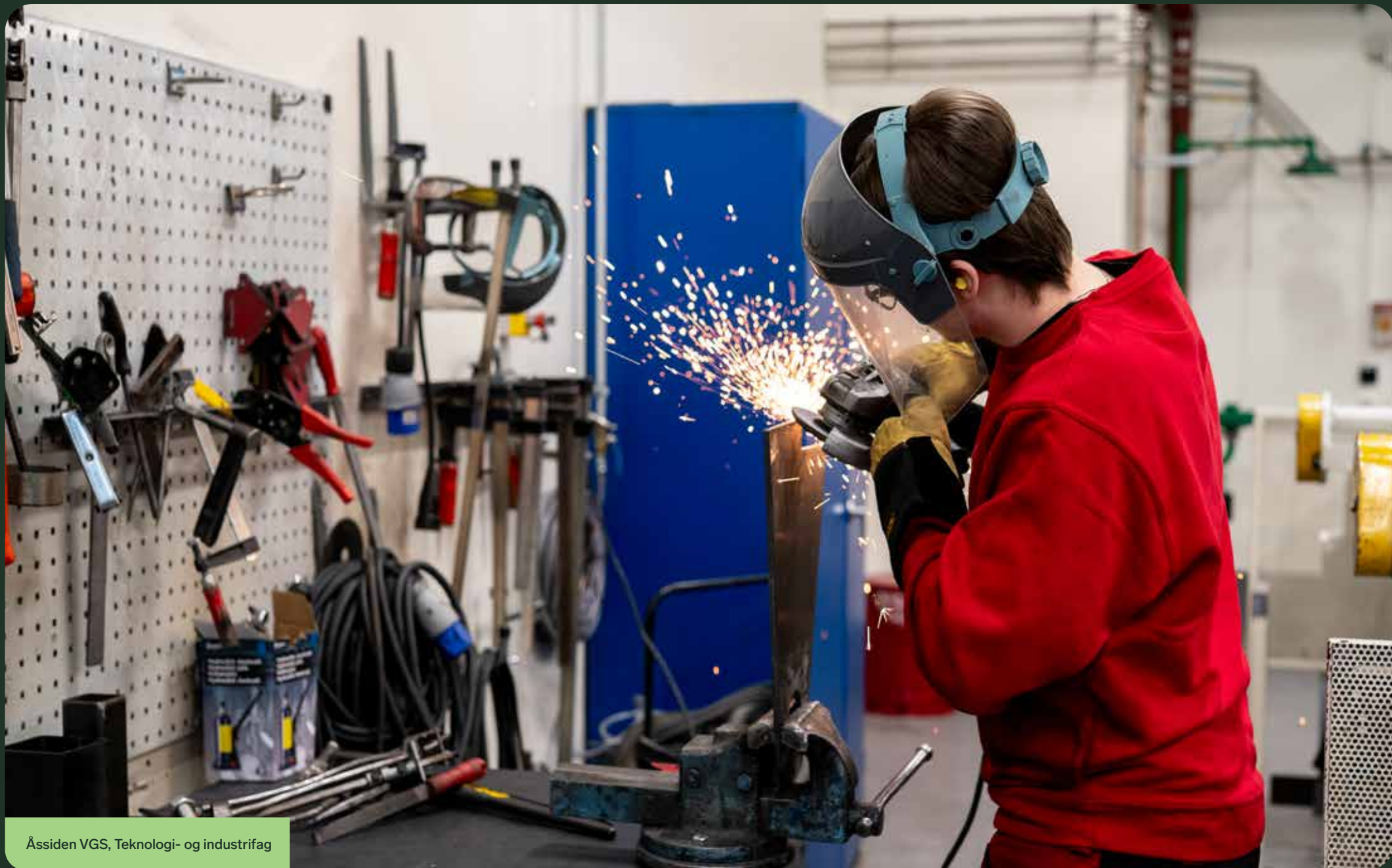
Åssiden VGS, Teknologi- og industrifag