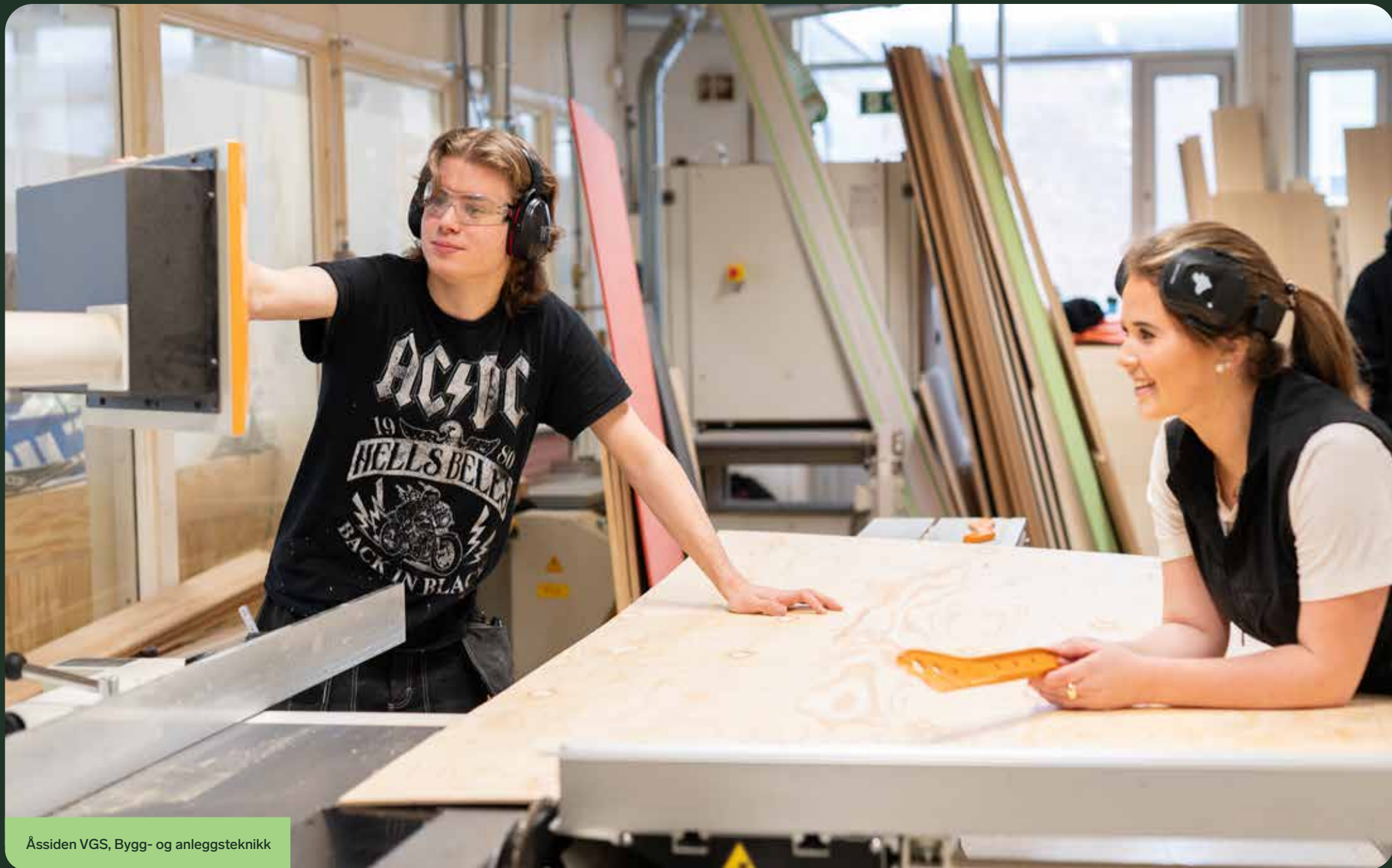
Åssiden VGS, Bygg- og anleggsteknikk