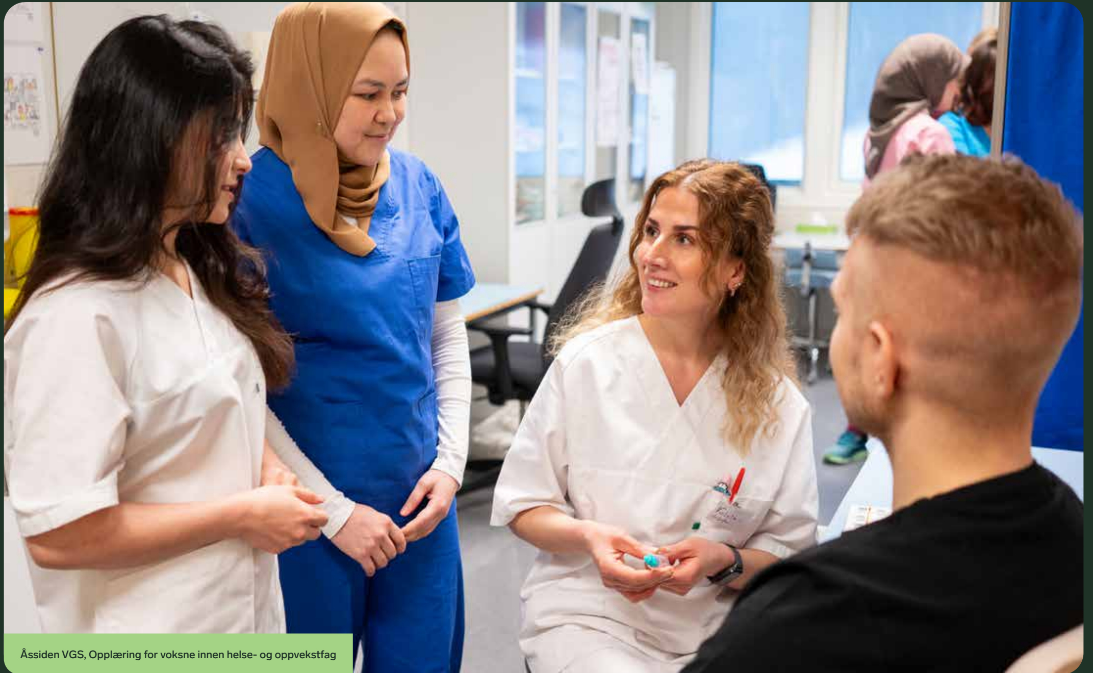
Åssiden VGS, Opplæring for voksne innen helse- og oppvekstfag