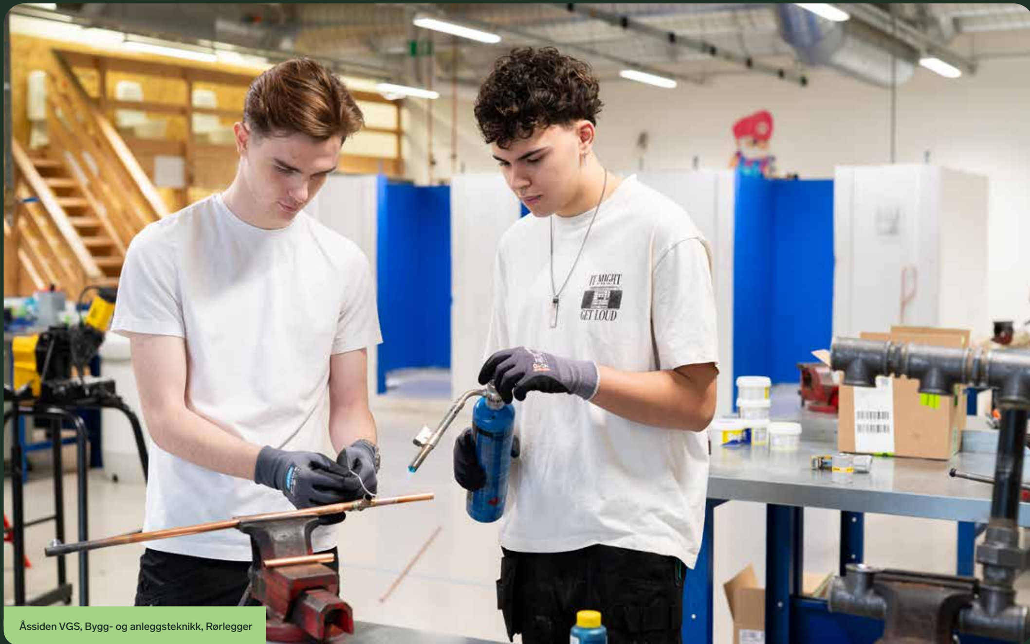
Åssiden VGS, Bygg- og anleggsteknikk, Rørlegger