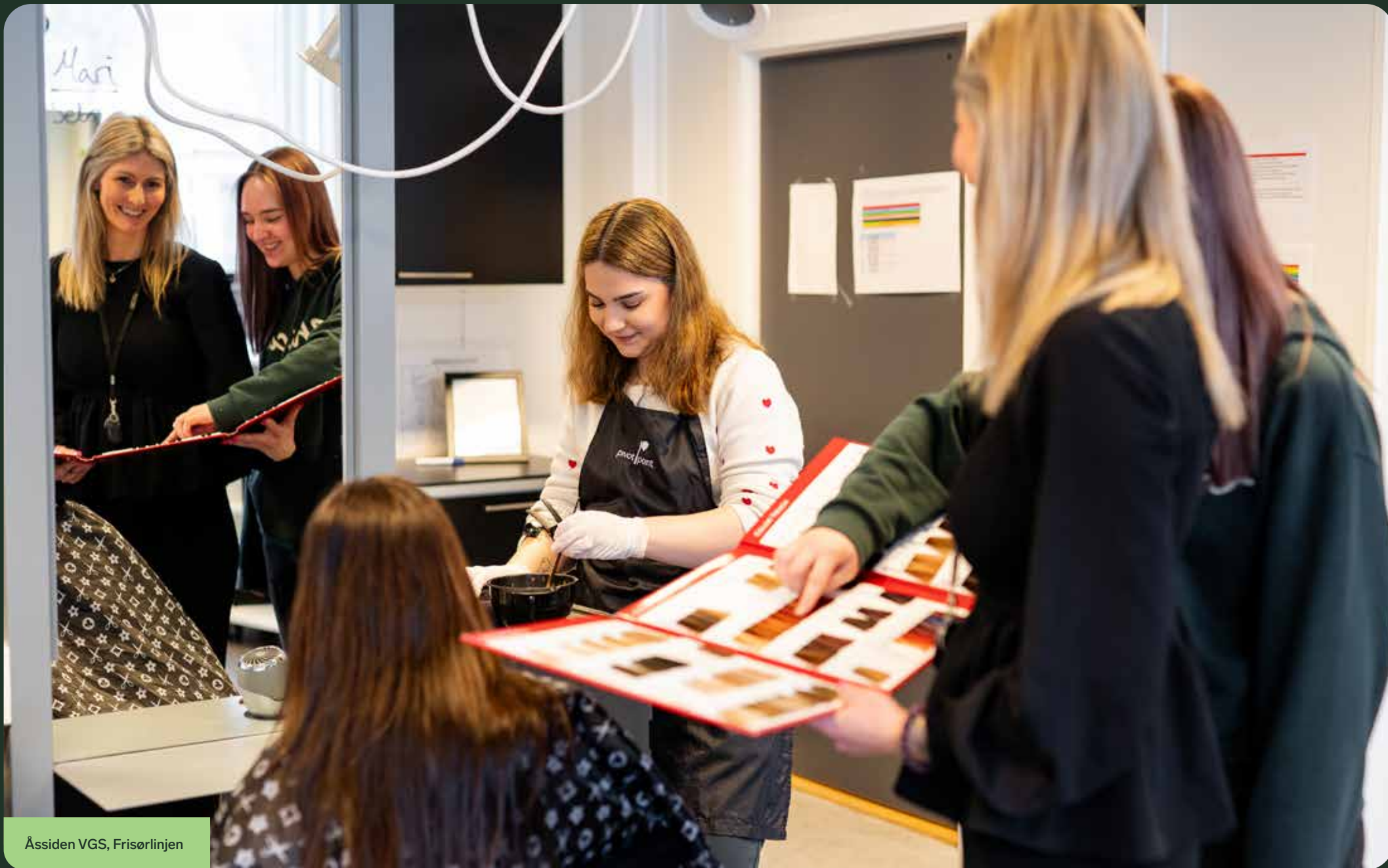
Åssiden VGS, Frisørlinjen