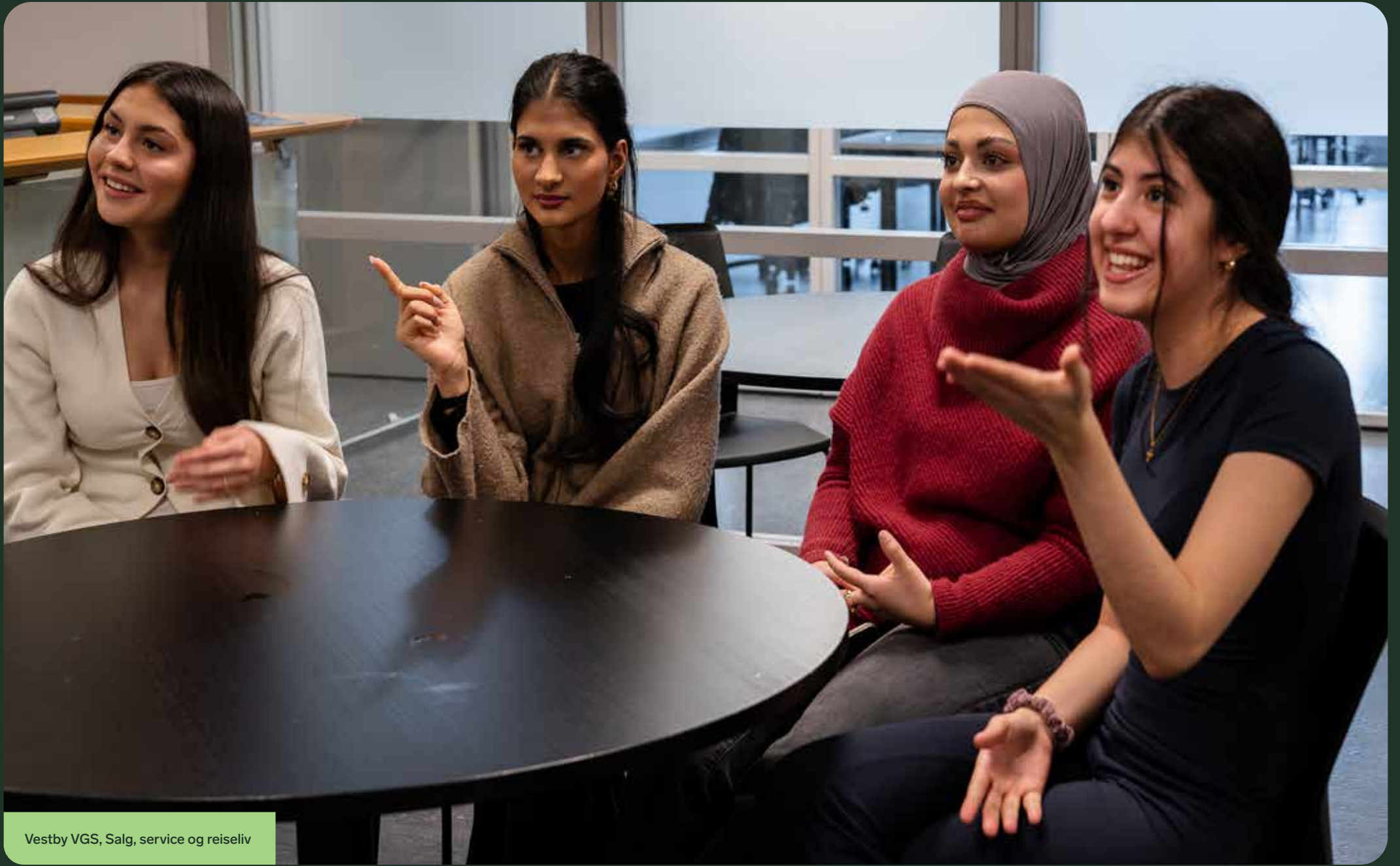
Vestby VGS, Salg, service og reiseliv