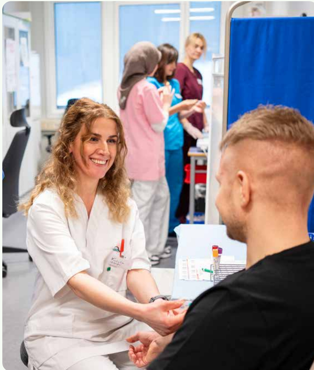
Ved Åssiden videregående skole tilbys det opplæring for voksne innen helse- og oppvekstfag.

Aksjefond, hedgefond, private equity-fond, infrastrukturfond, eiendomsfond og rentebærende verdipapirer forvaltes eksternt, mens direkte eiendomsplasseringer forvaltes internt. Utlån administreres eksternt av Intrum AS med godkjeningsprosesser internt.