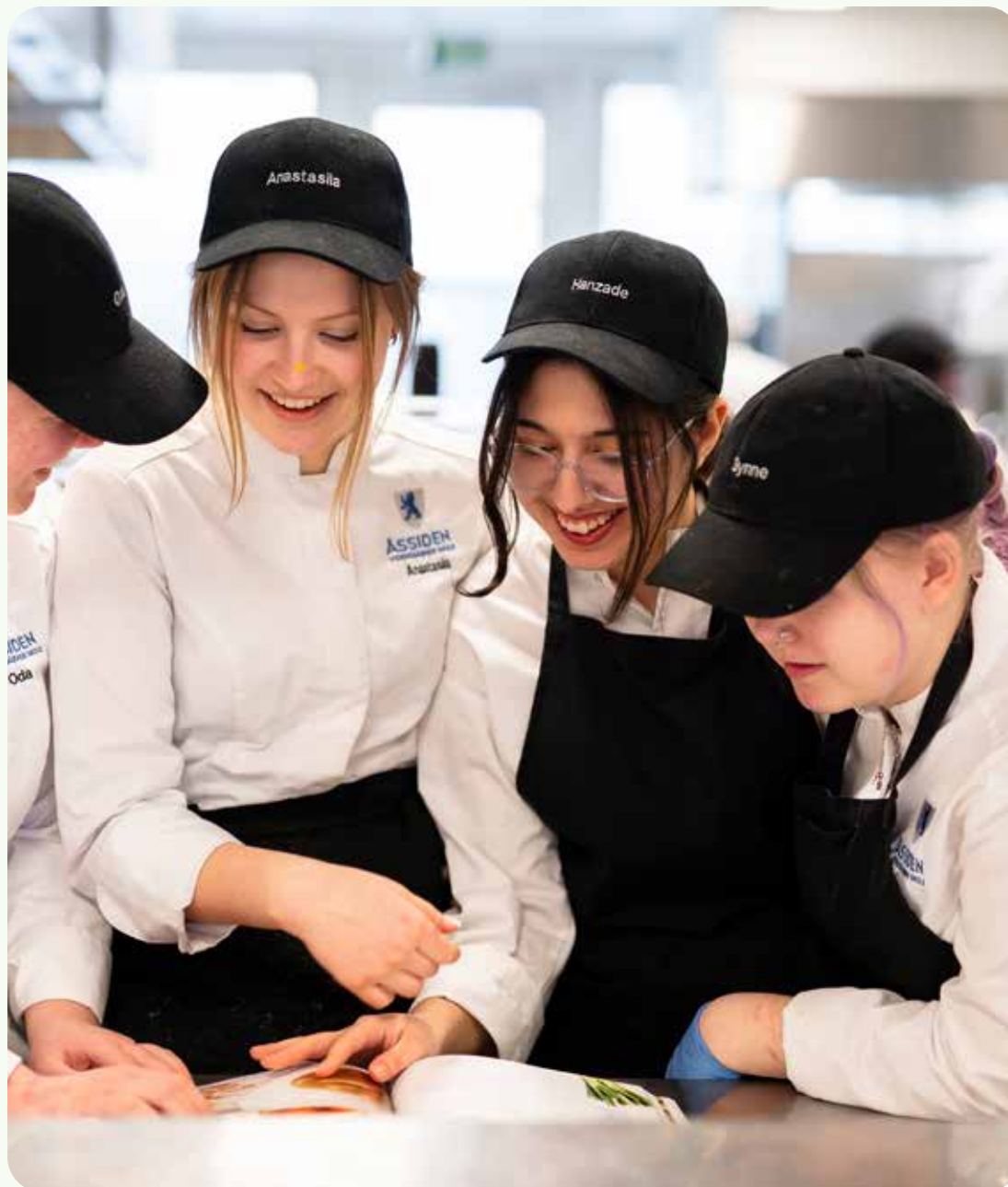
Utdanning og kompetanseutvikling er sentrale faktorer i sosial bærekraft.

Vi har også vurdert porteføljens ESG-rating. Dette er en karakter som gis til de underliggende selskapene av dataleverandøren som vi har benyttet (MSCI ESG), og er et mål på selskapets langsiktige tilpasningsdyktighet til risikofaktorer knyttet til ESG. Samlet får pensjonskassens børsnoterte portefølje A. Analysen benyttes for å avdekke om det er enkelte områder av porteføljen som presterer dårligere enn vi forventer oss, eller om utviklingen går i feil retning. Vurderingen per årsskiftet var at prestasjonen var god.