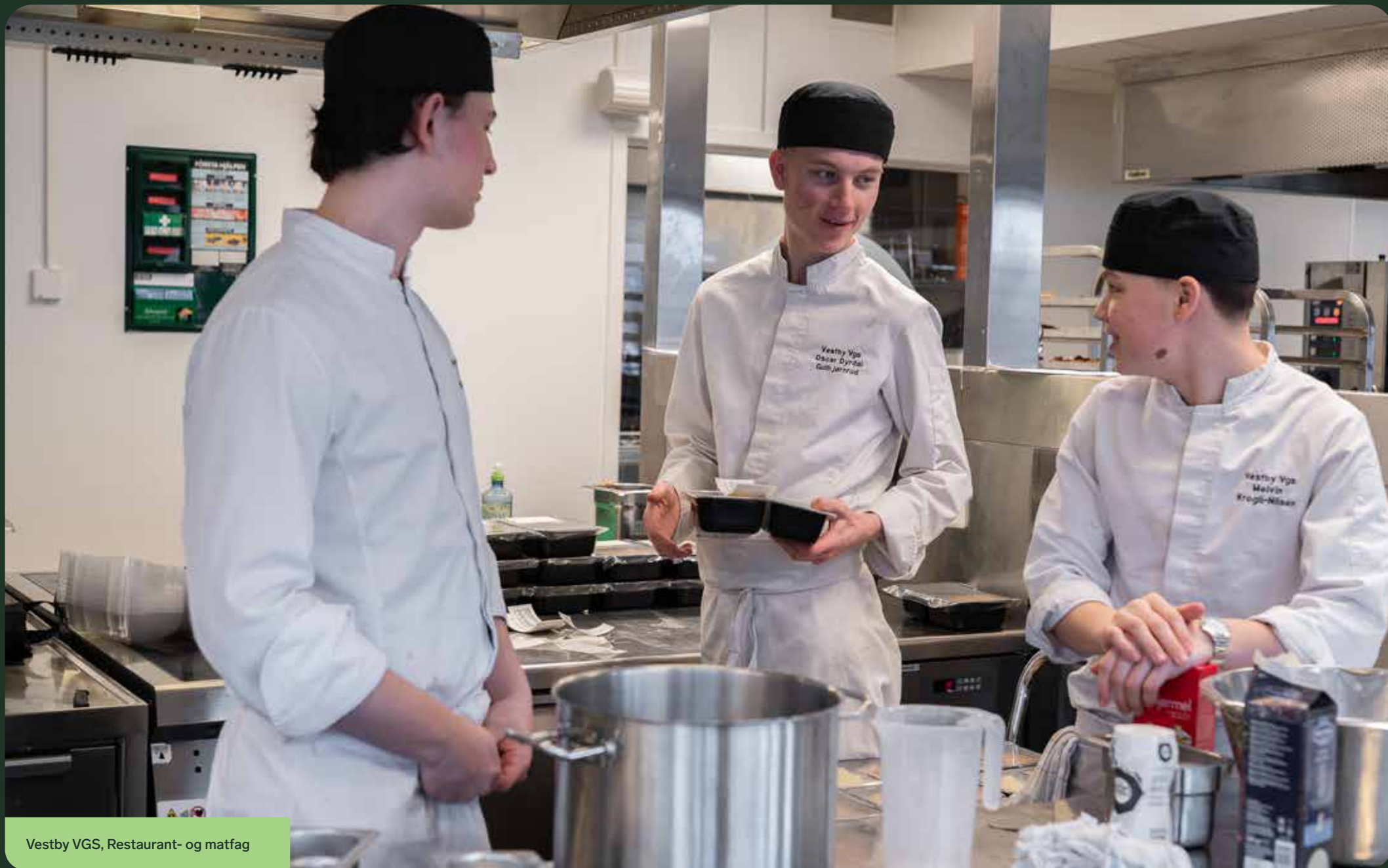
Vestby VGS, Restaurant- og matfag