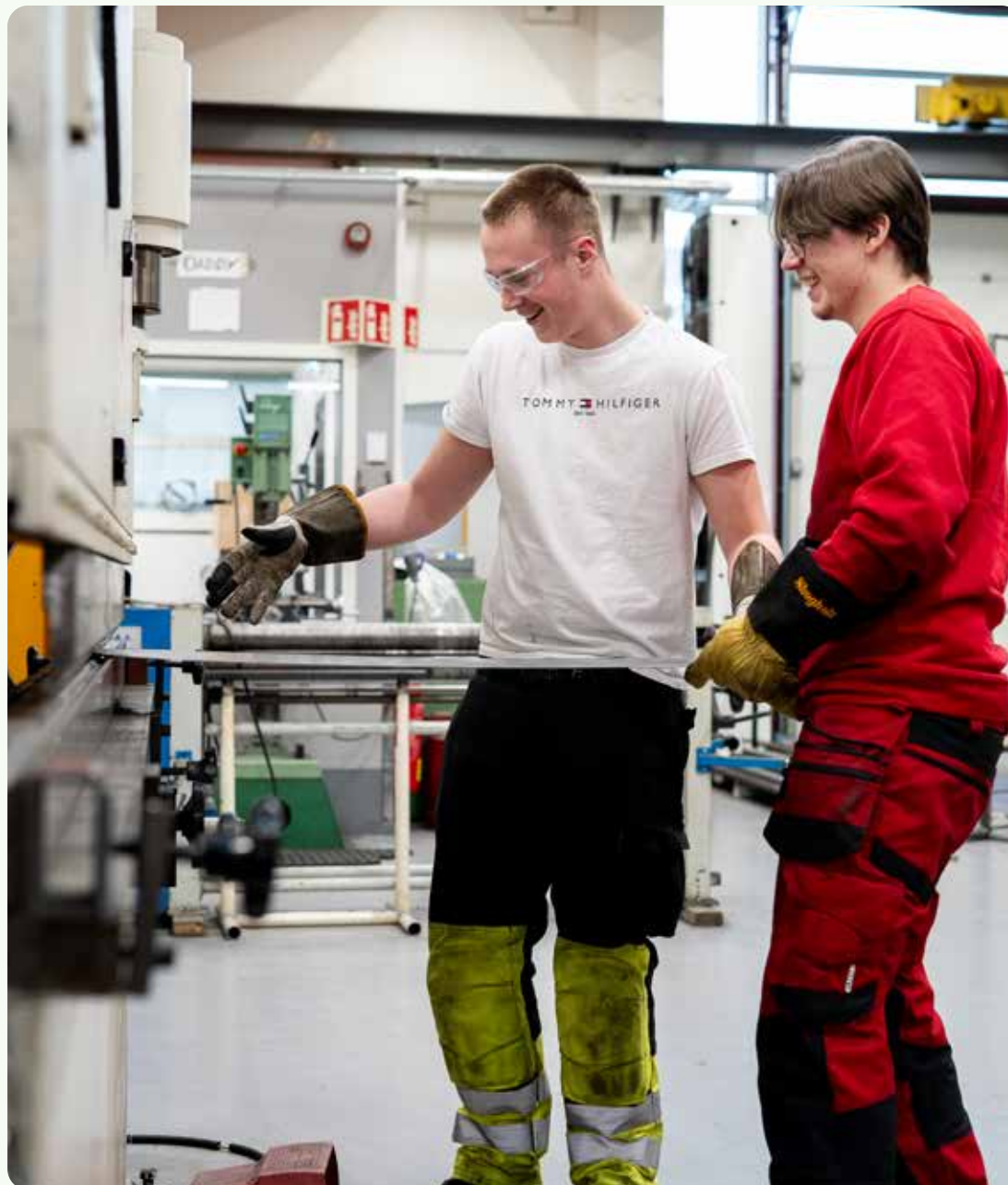
Det er viktig for verdiskapningen i Norge at flere velger yrkesfag i videregående skole.

PeKF har en god økonomisk og finansiell stilling.